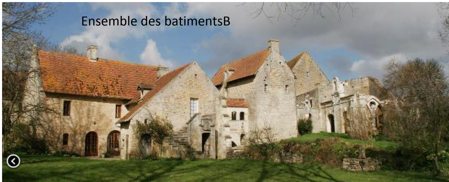
Ensemble des batimentsB