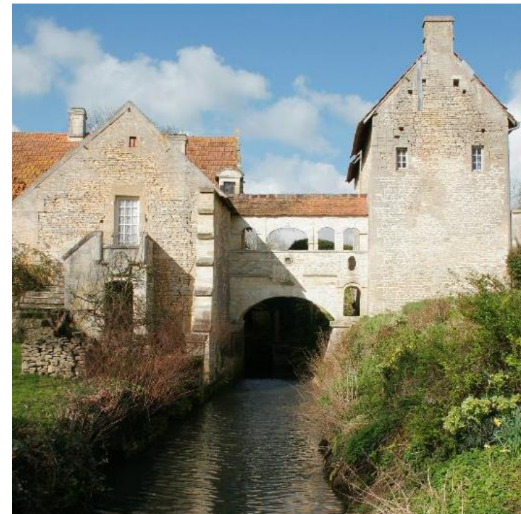
Bief de dérivation