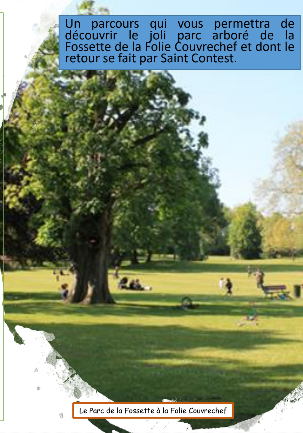
Le Parc de la Fossette à la Folie Cuvrechef

Un parcours qui vous permettra de découvrir le joli parc arboré de la Fossette de la Folie Cuvrechef et dont le retour se fait par Saint Contest.