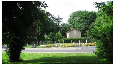
L'ancienne gare vue du chemin Sainte Anne et le chemin de l'ancienne ligne de chemin de fer.