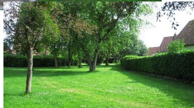
Cimetière britannique et la coulée verte du Parc