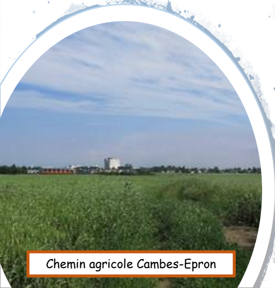
Chemin agricole Cambes-Epron