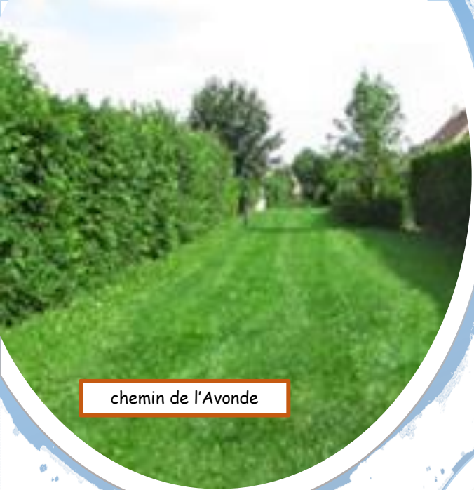
chemin de l'Avonde