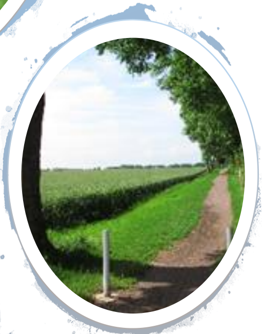
chemin de la 59th Staffordshire